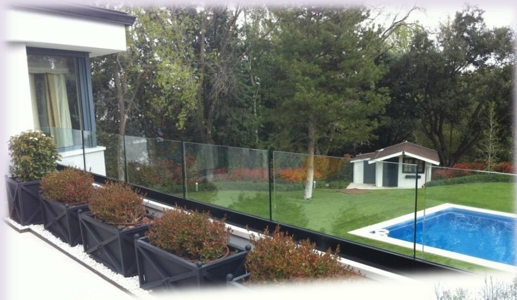
Barandilla con sistema GLASS-U realizado en vidrio laminado 8+8